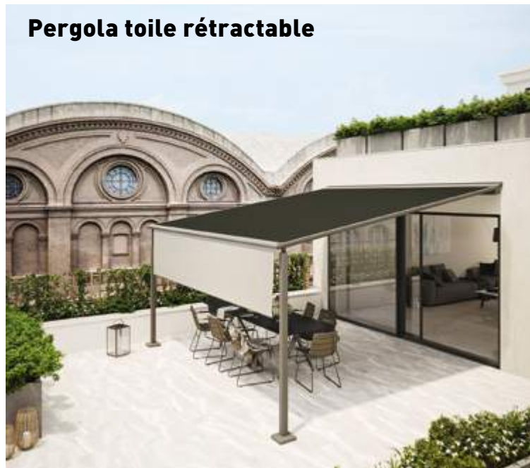
Pergola toile rétractable